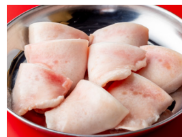
豚声帯(別名ノドブエ)

コリコリサクサクとした食感が特徴。焦げないように注意しながら4回程ひっくり返し、両面じっくり焼く。