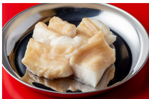
牛小腸(別名マルチョウ)

甘くてプリプリの脂が特徴。まずは脂面をサッと焼き色つける程度に、皮面からじっくり火を入れて脂が落ち過ぎないように焼く。